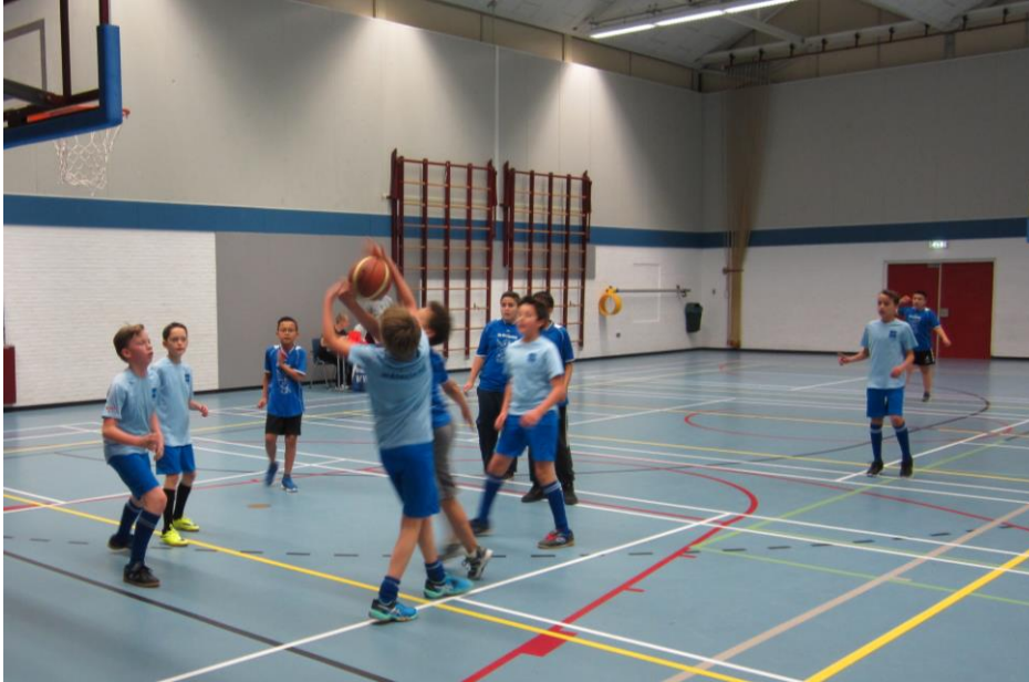
Naschools basketbaltoernooi voor de groepen 8

Naast aandacht voor leren, is het voor kinderen erg belangrijk dat er ruim voldoende aandacht aan bewegen besteed wordt. Naast onze reguliere gymlessen organiseren we ook een sportdag en nemen we deel aan diverse naschoolse sporttoernooien.