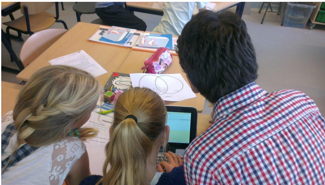
Samenwerkopdracht in de bovenbouw

Al vanaf de eerste schooldag wordt uw kind geconfronteerd met deze uitgangspunten. Ieder kind krijgt de verantwoordelijkheid die het aankan. Al snel blijkt dat ook jonge kinderen zich hier heel plezierig bij voelen. Zij worden namelijk gestimuleerd iets te doen dat zij zelf ook aankunnen. U heeft uw kind vast wel eens horen zeggen: "Ikke zelf doen".