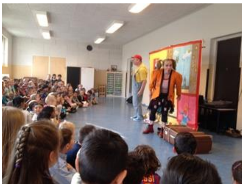
Een toneelvoorstelling voor de kleuters

De overheid vergoedt de schoolkosten voor een groot deel. Dit budget is echter beperkt en is niet bedoeld voor extra activiteiten binnen de school. De school vraagt daarom een vrijwillige bijdrage aan de ouders. Met dit geld organiseren wij verschillende activiteiten voor de kinderen, zoals museumbezoeken, toneelvoorstellingen, sport- en spelactiviteiten, het Sinterklaasfeest, de kerstviering en schoolreisjes.